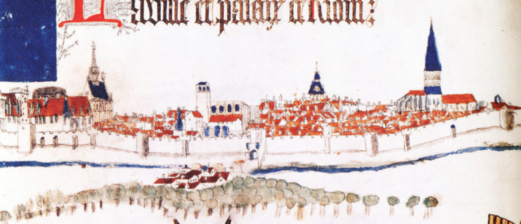
« La ville et palais de Riom » par Guillaume Revel, vers 1450.